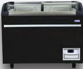
Mod. NEVADA 1030