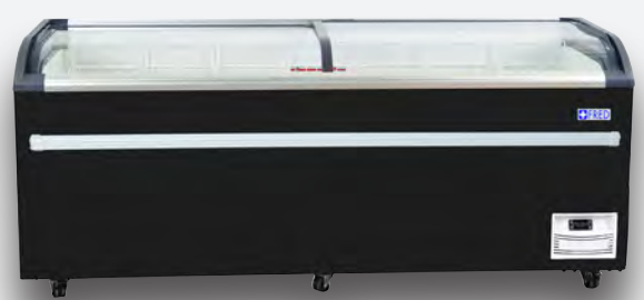
Mod. NEVADA 2000