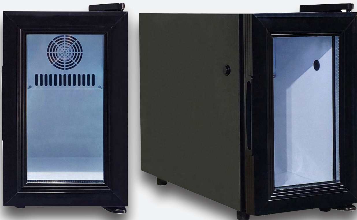
Mod. EXPO MILK 0.85