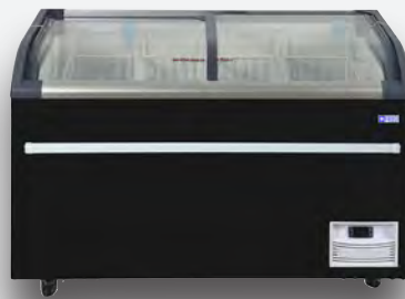
Mod. NEVADA 1270