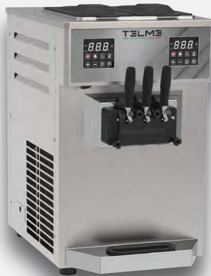
Mod. SOFT 350 CP PROF