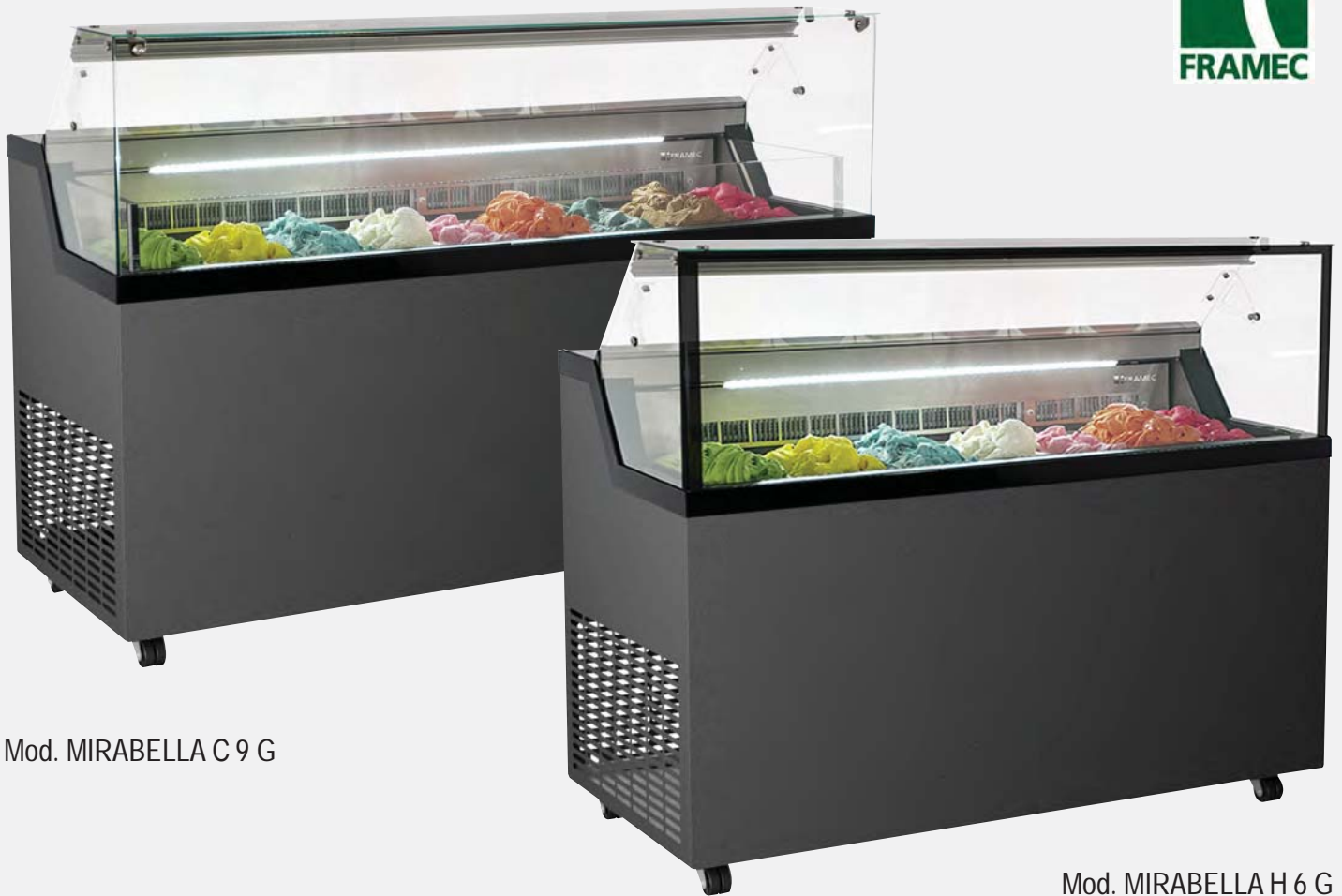
Mod. MIRABELLA C 9 G