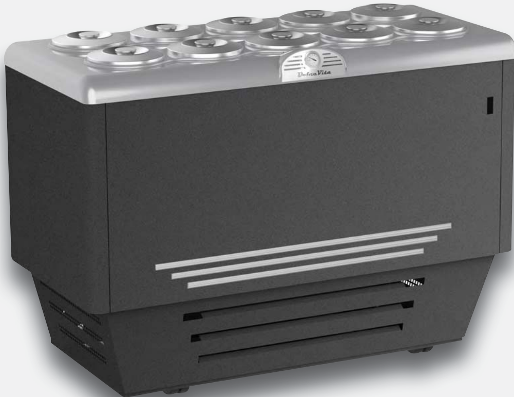
Mod. DOLCE VITA G