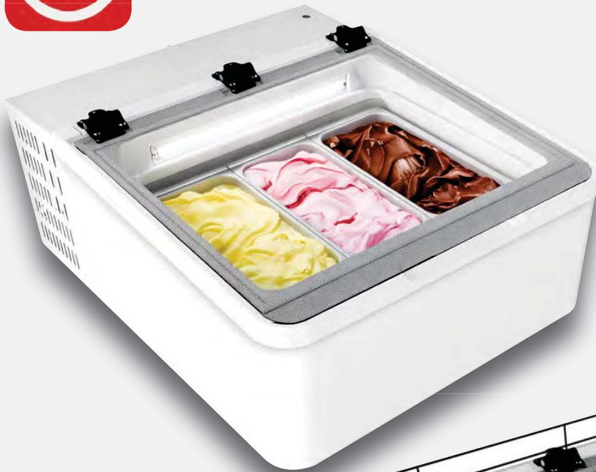
Mod. MINI CREAM 3V W LED