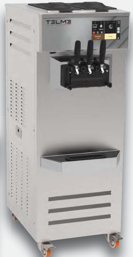
Mod. SOFT T370 VP TOP