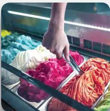
La primera vitrina estática con 3 laterales de exposición a ras de la bandeja.