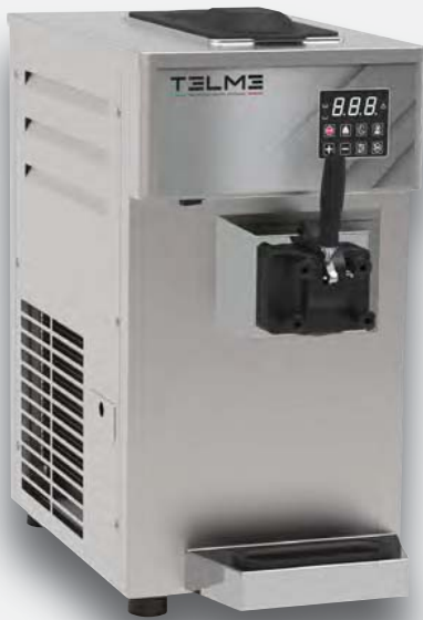
Mod. SOFT 125 CP PROF