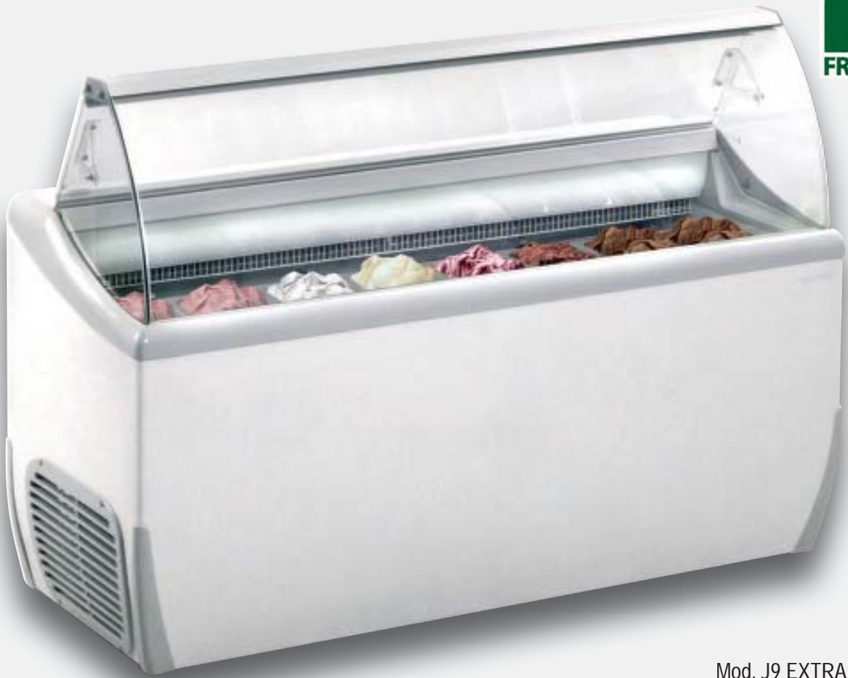
Mod. J9 EXTRA