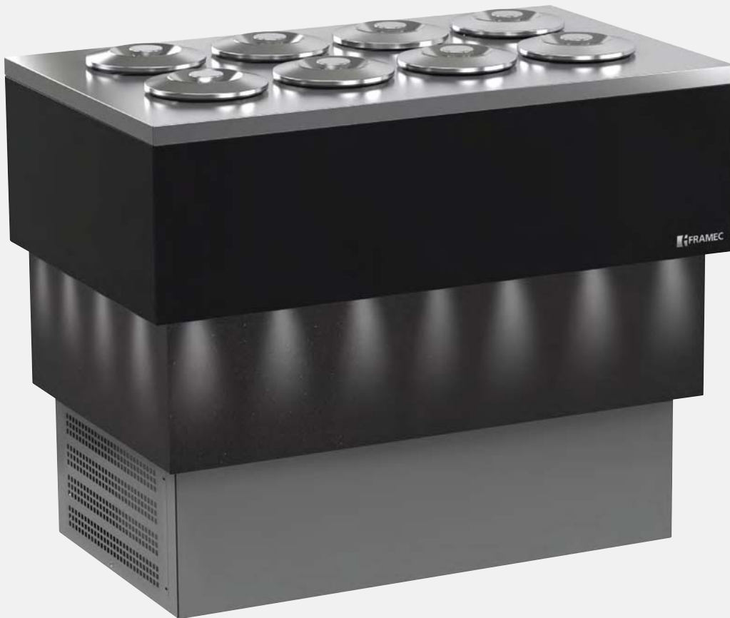
Mod. CARRARA DARK 8