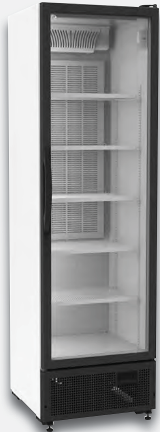
Mod. 420 DTK SZ