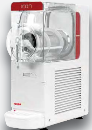
Mod. ICON 6/1