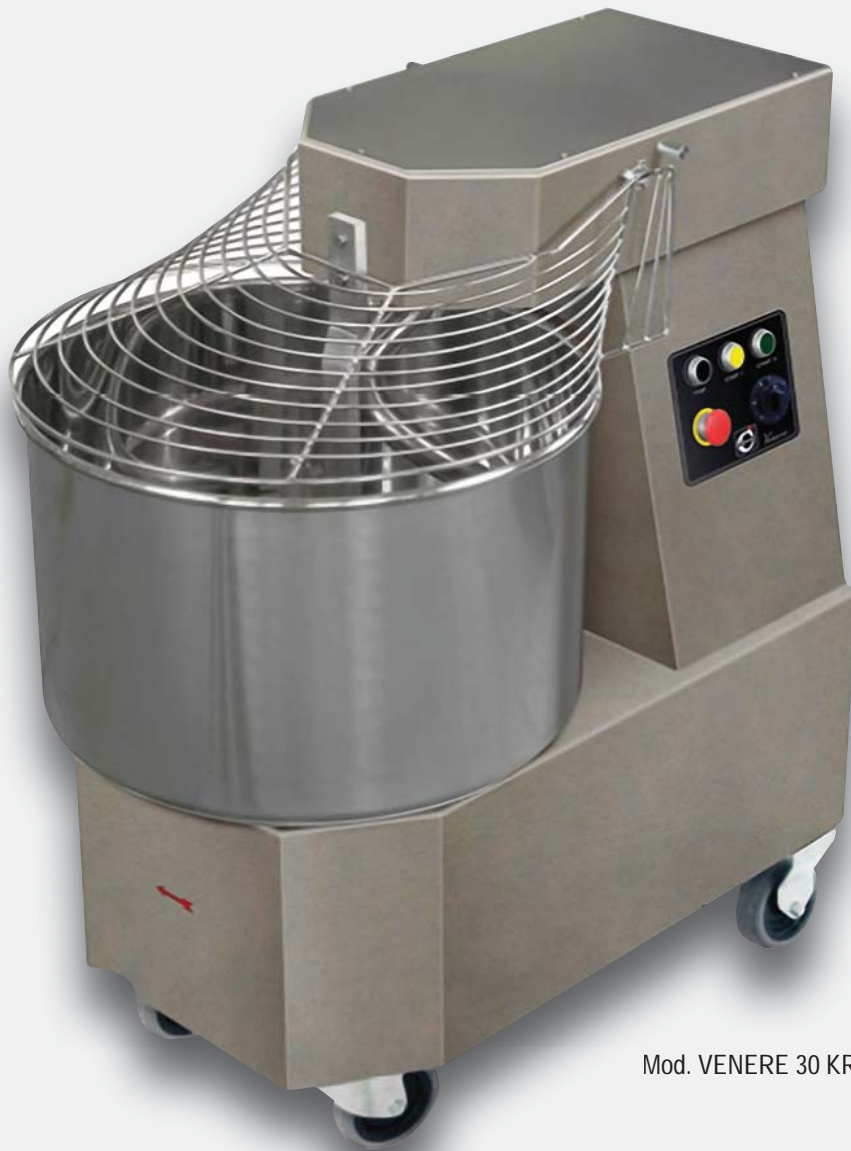
Mod. VENERE 30 KR