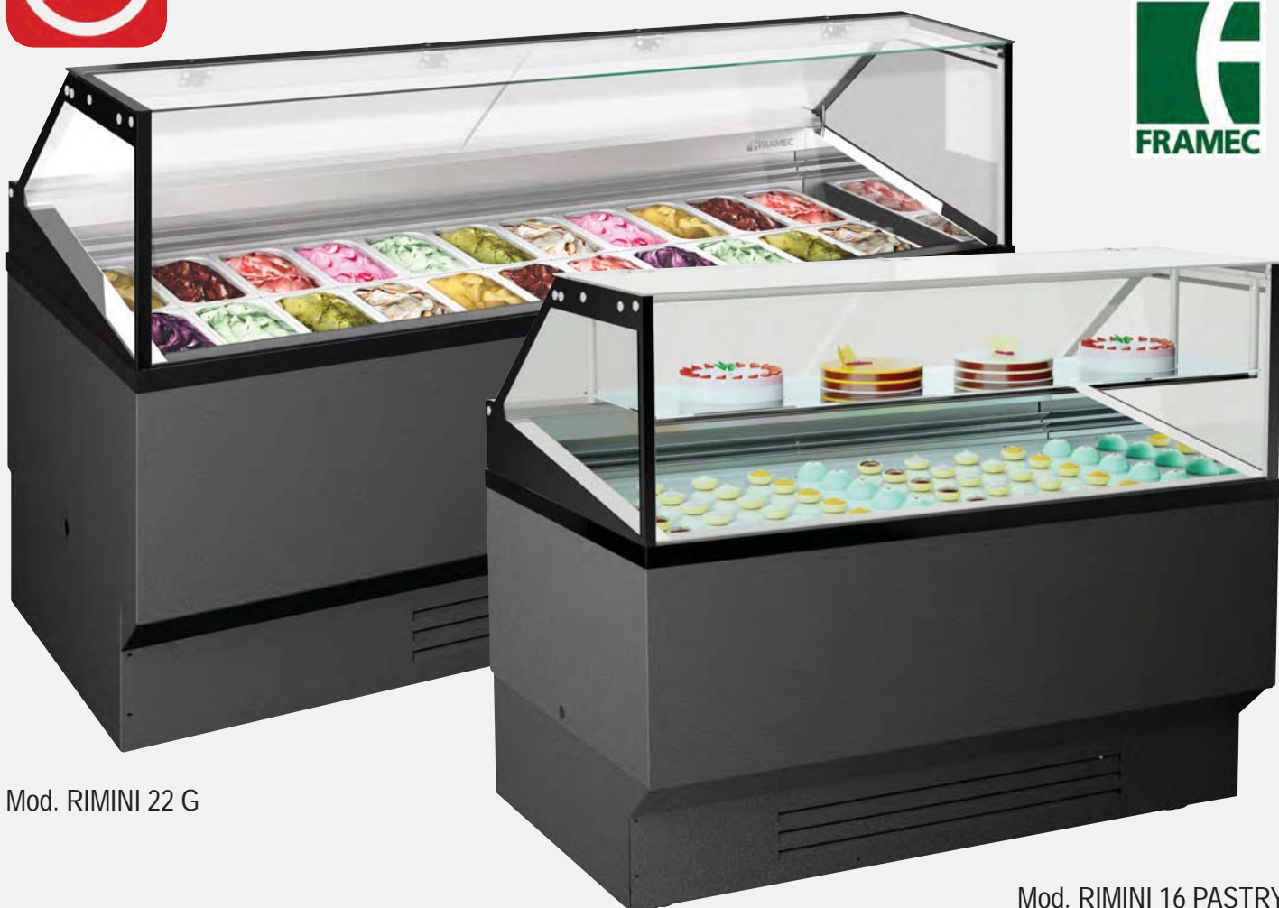
Mod. RIMINI 22 G