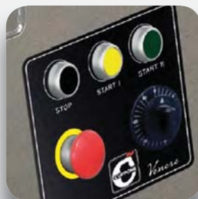
Panel mandos, 2 velocidades.