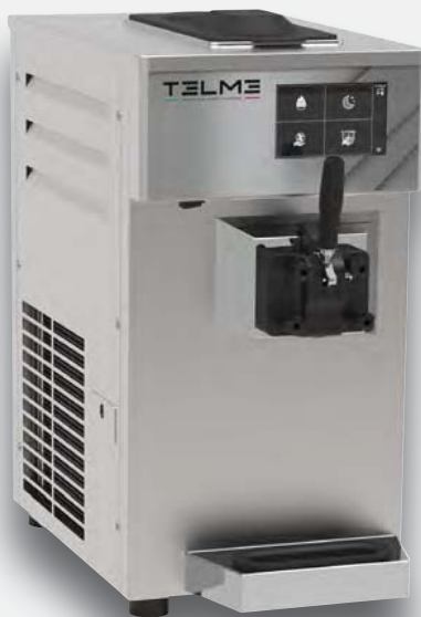
Mod. SOFT T135 CP TOP