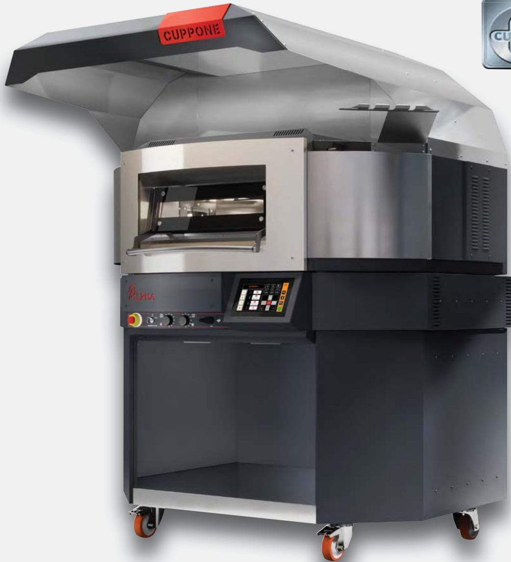
Mod. AO 110/1TS