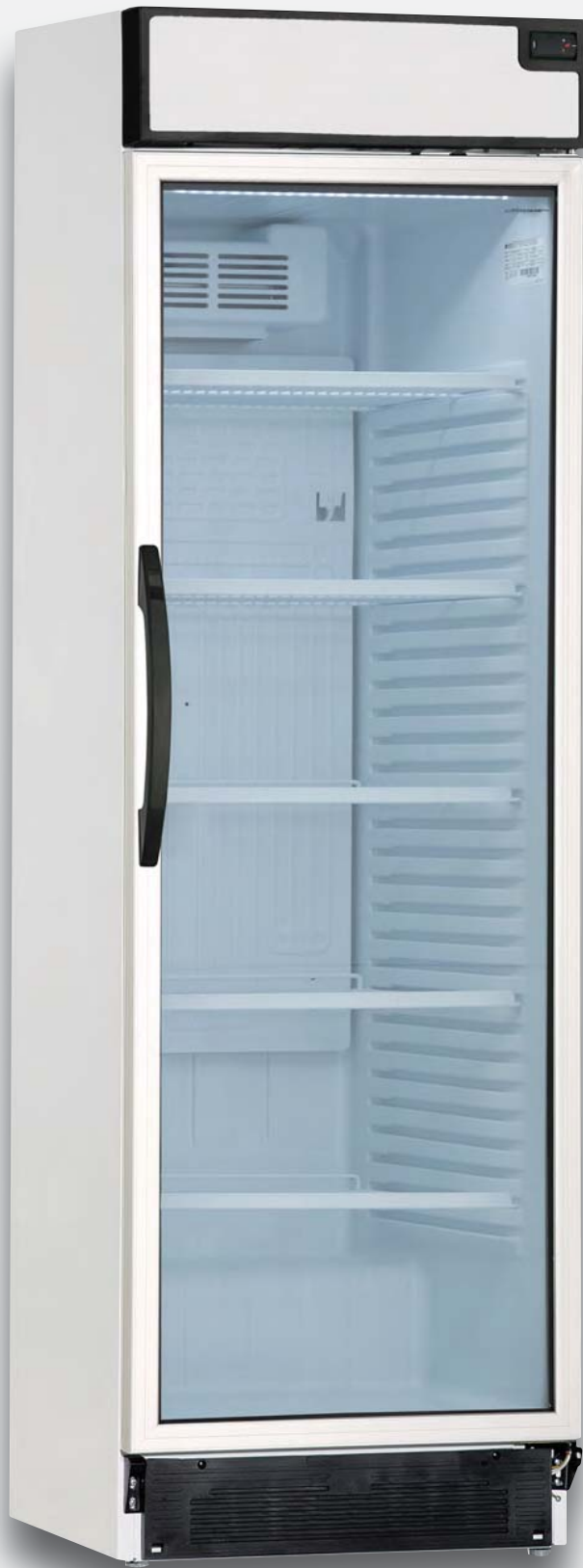
Mod. 374 DTKL SZ