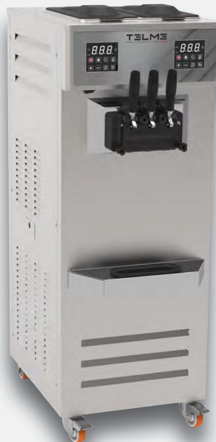
Mod. SOFT 350 VP PROF