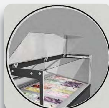
Apertura superior, facilidad limpieza.