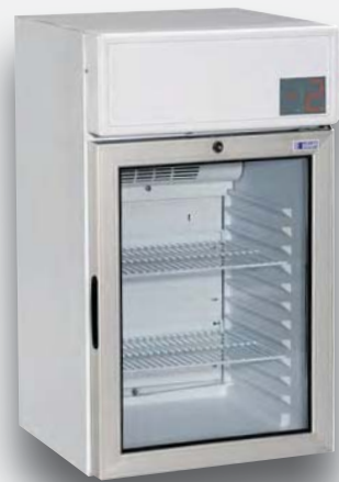
Mod. 100 DTKL SZ