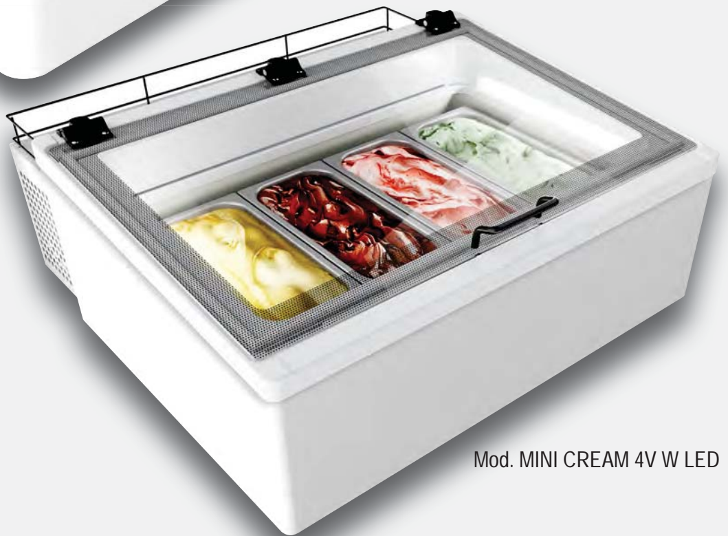
Mod. MINI CREAM 4V W LED