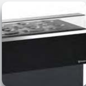
Mostrador servicio plexiglass.